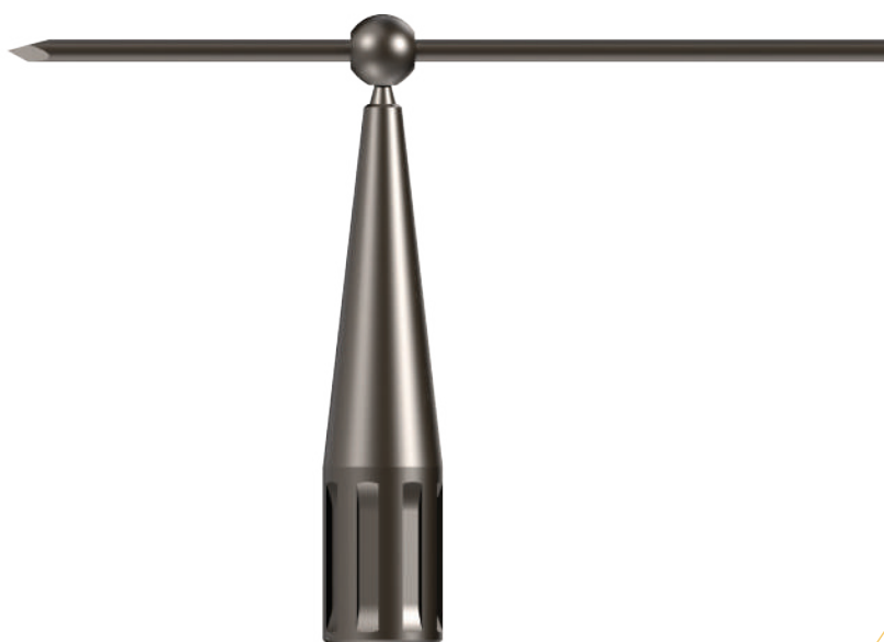
BROCHE FILETÉE ET EMBOUT ANTI-MIGRATION